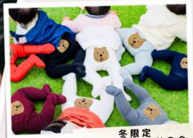
冬限定 くまさんタイツの会