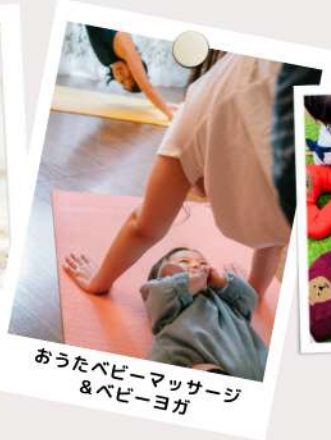
おうちベビーマッサージ & ベビーヨガ